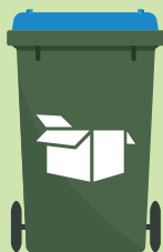
Oud papier en karton

Meer weten over afval scheiden? Kijk in de ACV-app of op www.acv-groep.nl .